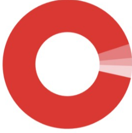
Güncel Fon Dağılım Oranı