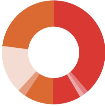
Güncel Fon Dağılım Oranı