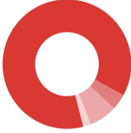
Güncel Fon Dağılım Oranı